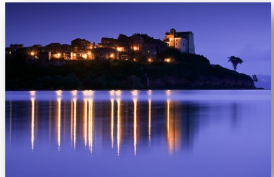
Lago di Bracciano