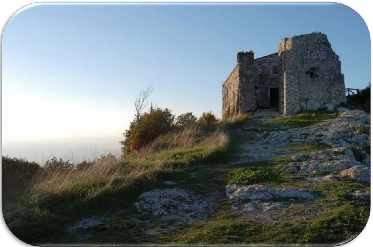
Il bunker di Mussolini a Sant'Oreste

La cima più alta della provincia si trova sui monti Simbruini con il Monte Autore (m. 1.855) in località Vallepietra, altre cime importanti si trovano sui Monti Lucretili con il Monte Pellecchia (m. 1.368) ed il Monte Gennaro (m. 1.271). Oltre ai suddetti gruppi montuosi sono da menzionare il Monte Soratte ed i Monti Cornicolani, che costituiscono la cosiddetta Dorsale Tiberina , una dorsale carbonatica risalente al periodo meso-cenozoico.