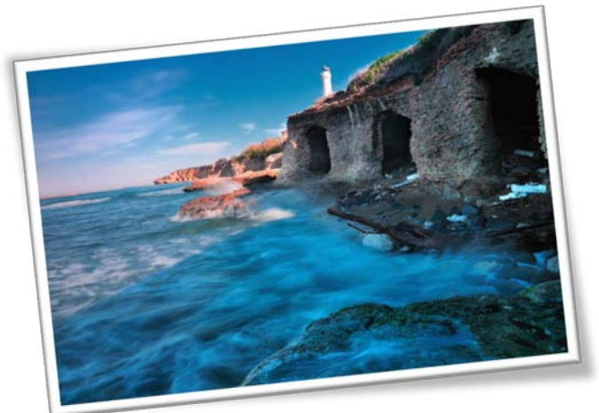
Grotte di Nerone - Anzio RM

Un mare, quello della provincia di Roma, frequentato soprattutto dagli abitanti del capoluogo e delle zone limitrofe, più volte premiato dalla FEE con la Bandiera Blu (Anzio per le spiagge, Nettuno, Civitavecchia e Lido di Ostia per i rispettivi porti), e caratterizzato da numerose torri e fortificazioni, che si ergono su tutta la costa; tra di esse il Castello di Santa Severa, il Castello di Palo a Ladispoli, Tor San Lorenzo ad Ardea e Torre Astura e il Forte Sangallo a Nettuno sono i più conosciuti.