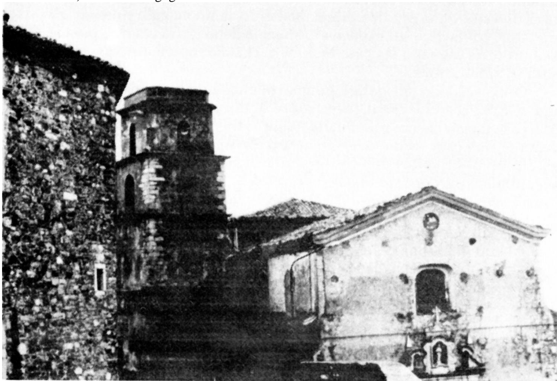
Scorcio della Chiesa Madre con l'annesso campanile, ristrutturato nel "700. Sulla sinistra si riconosce un angolo del castello