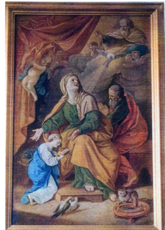
Figura 4 L'educazione della vergine di G. Del Buono