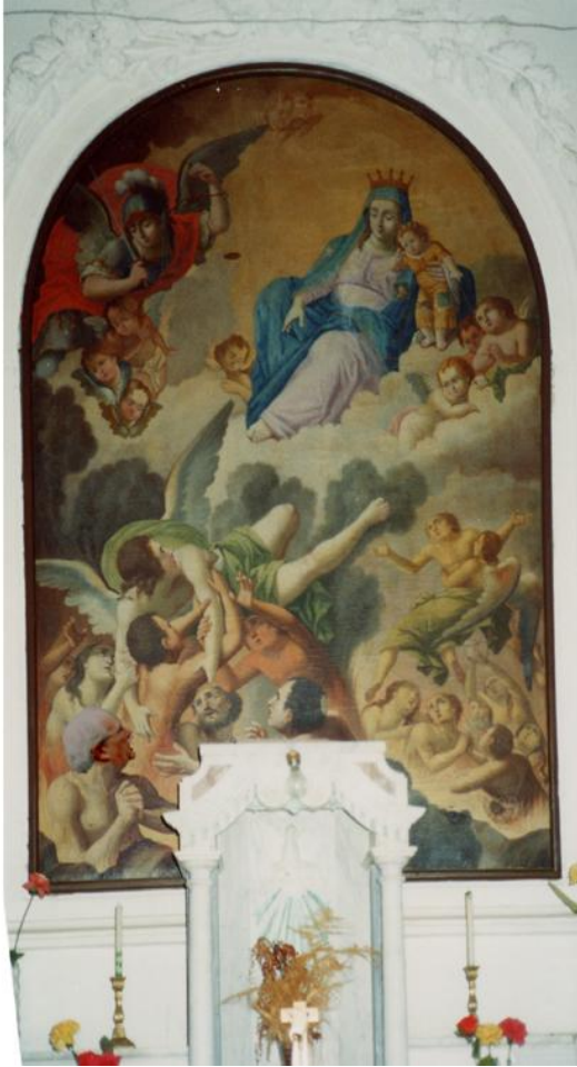
Figura 2 La Madonna Del Carmine di G. Del Buono

l'immagine del Carmine, che porta in basso la scritta "Cajetanus Del Buono pinxit 1814", e facilmente riconoscibile tra due tele del 1895 firmate Giuseppe Sampietro. La Madonna col Bambino, cinta di manto azzurro, e assisa su bianche nubi e circondata da angioletti; e protetta, quasi scortata, da un arcangelo guerriero dalla tunica rossa mentre un altro angelo, drappeggiato in verde, trattiene una folla di anime imploranti.