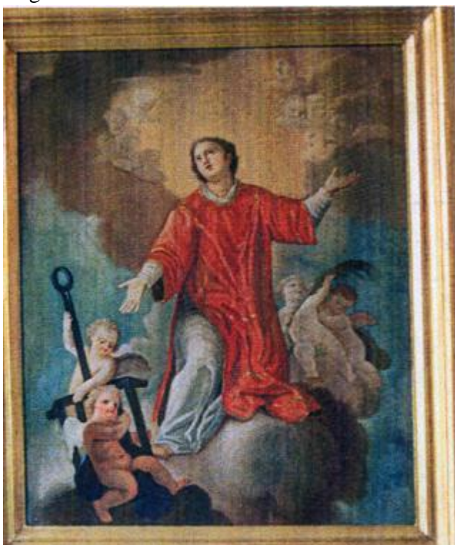
Figura 5 San Lorenzo di G. Del Buono

Gli eredi conservano invece altri tre ritratti di famiglia 14 , che definiremo per comodità A, B e C, molto interessanti per la nostra ricerca perché rappresentano chiaramente un pittore: reggono tutti nella destra un pennello, ed in più in C si riconosce sullo sfondo un quadro tratteggiante una Madonna, mentre in B l'uomo porta in mano un foglio da disegno su cui è abbozzato un occhio. I tre personaggi dimostrano un'età diversa che, indicativamente, appare sui 25-30 anni nel quadro più antico (A), sui 40 in quello intermedio (B), sui 55 in quello più moderno (C). Chiariamo intanto che le tre tele sono pressoché identiche per dimensione: misurano infatti cm. 50x60 (ritratto A), cm. 50x63 (B), cm. 51x59 (C). Per quanto concerne le fattezze dei tre uomini, A e B sono molto simili, persino negli abiti (giacca scura e marsina), mentre C, che la tradizione familiare identifica nel nostro Gaetano, presenta lineamenti diversi ed un abbigliamento più informale (giacca marrone su maglione girocollo sotto il quale spunta il colletto di una camicia bianca). Mentre siamo ragionevolmente certi che C sia un autoritratto di Gaetano, non sappiamo se classificare come tali anche A e B, riferendoli ad un'età più giovanile, ovvero considerarli opere di Giuseppe ed addirittura suoi autoritratti; mancano documentati elementi di riscontro, né il gioco delle somiglianze può venirci in aiuto, visto che Gaetano e Giuseppe erano fratelli.