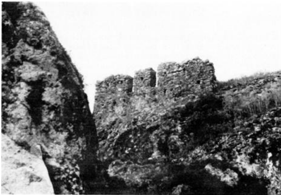
Particolari dei merli del "Piesco", dai quali si dominava la valle dell'Ufita.

I resti del "Piesco di Morra", antica fortificazione del XII secolo costruita su una roccia oggi in tenimento di Frigento. I Morra all'inizio del '200 erano Signori, tra l'altro, anche di S. Angelo dei Lombardi, di Caposele, di Viario (Teora) e Calabritto.