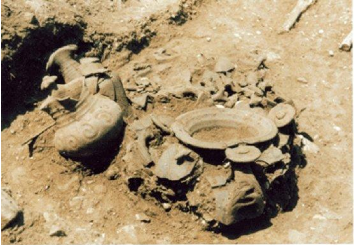
Immagini tratte dal saggio di scavo condotto nel giugno 1985 e riferentisi alla necropoli di Piano Cerasulo. I reperti sono databili tra il VI e il IV secolo a. C. e comprendono bracciali ad arco inflesso, fibule a navicella, vasellame, pendagli zoomorfi, punte di lancia.