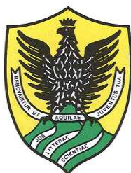
Facoltà di Scienze della Formazione