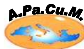
ASSOCIAZIONE PAESI E CULTURE MEDITERRANEE