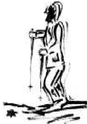
(Illustrazione di Chiara Arnaud e Daniela Ferrero – copyright Bradipolibri Editore S.r.l. Torino)

a suggerire respiro, inclinato sui bastoni, pensoso alla vittoria, all'intravisto risultato... Tutti gli amici, il pubblico, ad esultare insieme. Pensieri di ammirazione e sussulti, timori, a Forni, in quei giorni, per voi, Atleti del Mondo, d'autunno, sui prati.