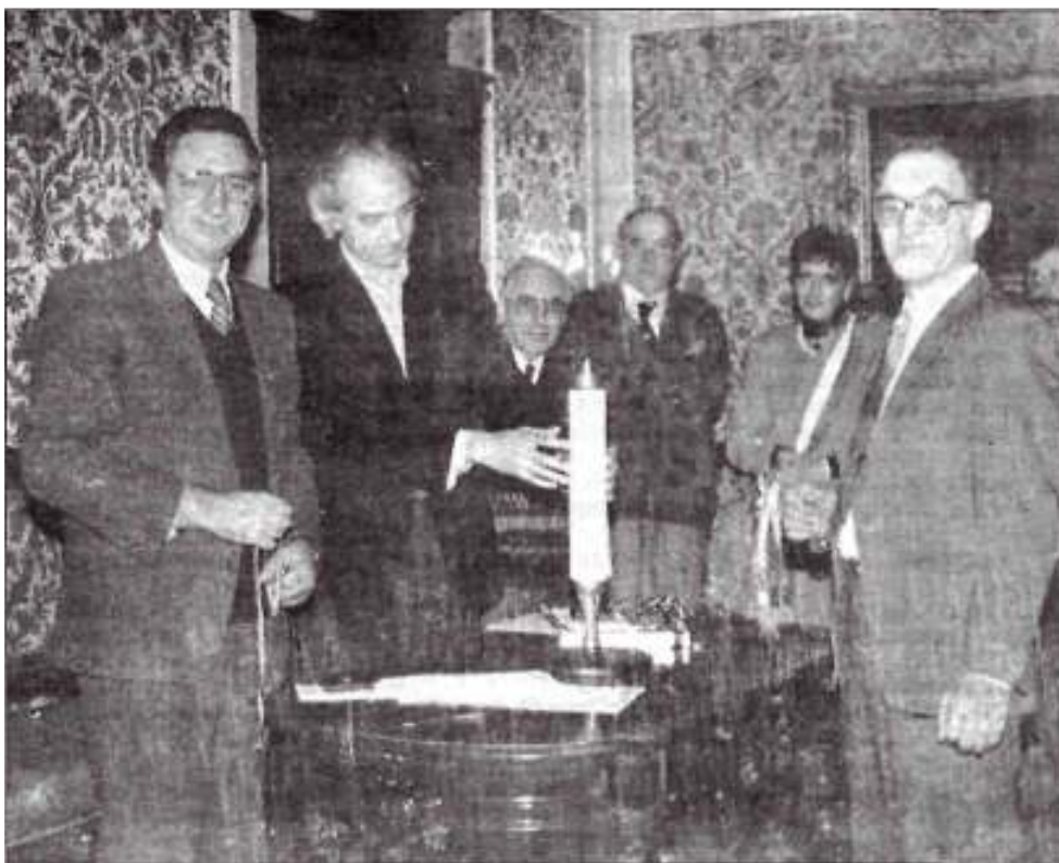
Un momento della manifestazione in Comune