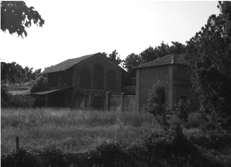
Insedimento rurale esistente di possibile recupero

All'articolata classificazione funzionale del territorio agricolo si accompagna anche una normativa per gli insediamenti rurali, in particolare per quelli che non sono più destinati all'attività agricola e che potrebbero essere recuperati con destinazione prevalente residenziale ma anche terziaria/turistica. Il Piano riconosce gli insediamenti rurali di recupero e consolidamento e ne incentiva il recupero nel rispetto dei caratteri tipologici e delle finiture tradizionali e del contesto rurale cui appartengono.