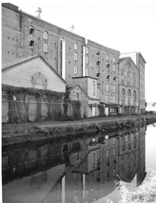
L'insediamento produttivo dei "Molini Certosa" Veduta dal Naviglio Pavese

Particolare attenzione è stata quindi riservata allo sviluppo delle attività terziarie con destinazione turistico ricettiva, in quanto l'afflusso di visitatori connesso alla presenza della Certosa di Pavia pone al primo posto la riflessione sulla dotazione di strutture ricettive e il relativo potenziamento dei servizi annessi. Al di là delle scelte strategiche già descritte nel Documento di Piano che individuano quattro ambiti di trasformazione con destinazione prevalente turistico ricettiva, nel Piano delle Regole, oltre a riconoscere le attività presenti sul territorio come insediamenti turistico ricettivi consolidati , si è cercato di dare una risposta alle richieste di nuove aree turistiche con una normativa flessibile per tipologia (albergo, residence, ristorazione, bed and breakfast ecc.) e distribuzione delle potenzialità edificatorie, sia in termini di incentivi per il recupero o la riconversione di aree sottoutilizzate e per ampliamenti e completamenti di strutture esistenti.