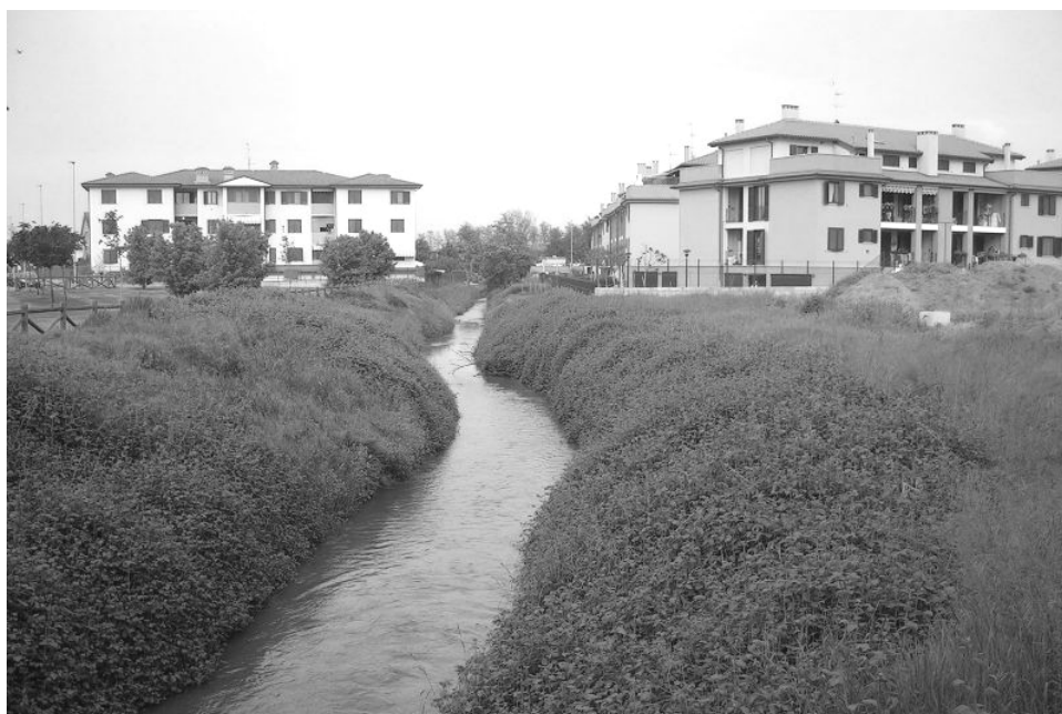
Ambito residenziale di recente formazione in margine all'abitato

Le modalità attuative che il PGT prescrive sono di conseguenza differenti per ciascuna tipologia di insediamento, in quanto, mentre per gli ambiti consolidati sono individuabili possibilità di ampliamento sino a saturazione dell'indice di riferimento, negli ambiti di completamento tale possibilità è data solo per i piani di lottizzazione vigenti con volumetrie residue e comunque nell'arco della validità temporale del piano stesso.