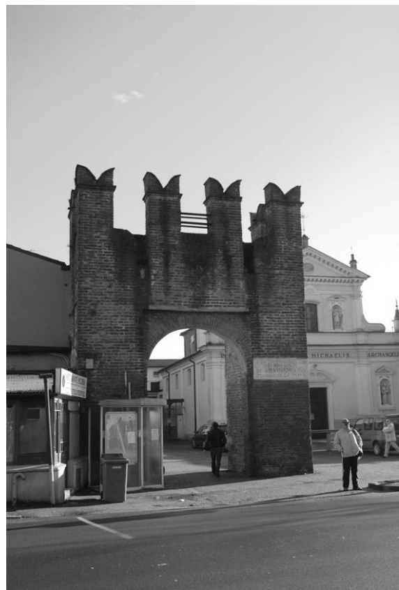
Torre del Mangano