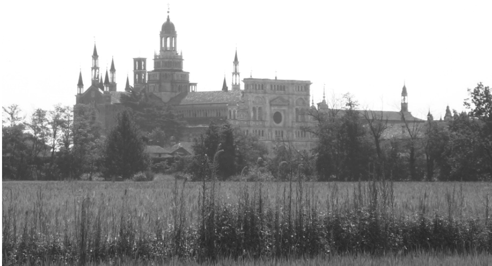
La "Certosa di Pavia". Veduta in direzione del Comune di Giussago