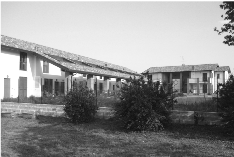
Insedimento rurale oggetto di recente recupero