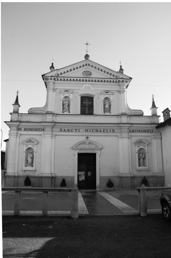
Chiesa parrocchiale San Michele