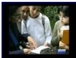
KSOE Teen Activity Programme