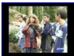
KSOS Children's Activity Programme