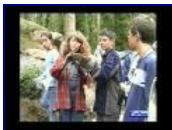
KSOS Children's Activity Programme