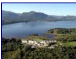
Killarney School of English Photos

http://www.youtube.com/user/FeargalCourtney