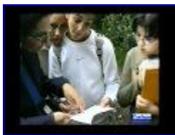
KSOE Teen Activity Programme