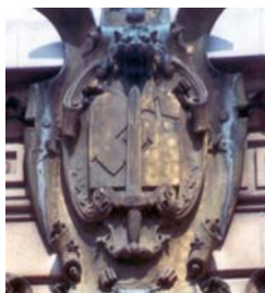
Gladius legis custos

Per noi Nazionalpopolari chiunque è libero di professare qualsiasi religione senza nessun impedimento purché questa non sia in contrasto con le leggi e gli interessi dello Stato.